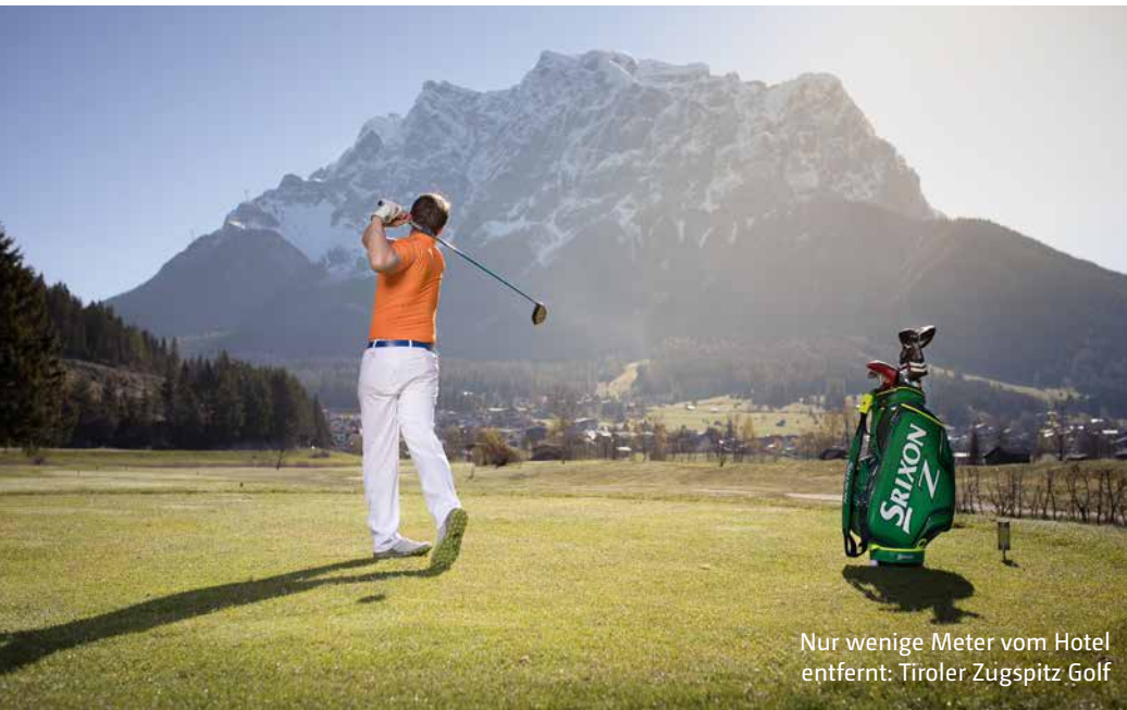
Nur wenige Meter vom Hotel entfernt: Tiroler Zugspitz Golf