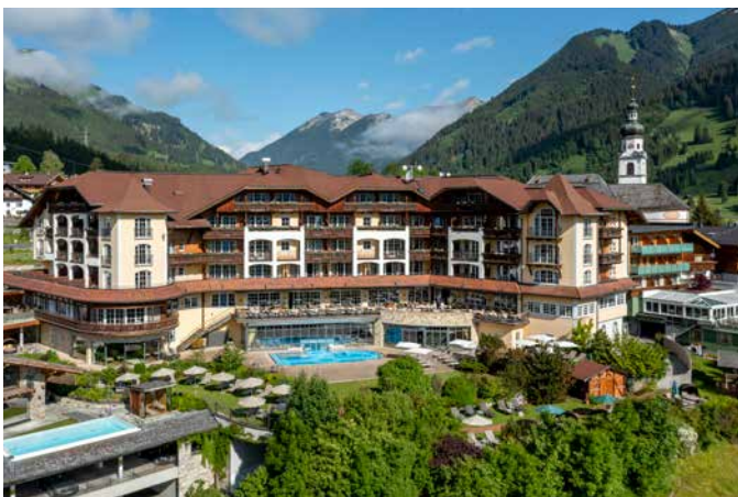
Exklusives Urlaubsdomizil: Das Genießerhotel Post Lermoos in Tirol