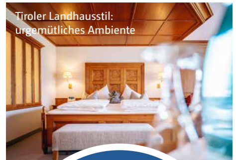
Tiroler Landhausstil: urgemütliches Ambiente