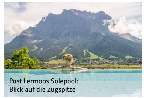
Post Lermoos Solepool: Blick auf die Zugspitze