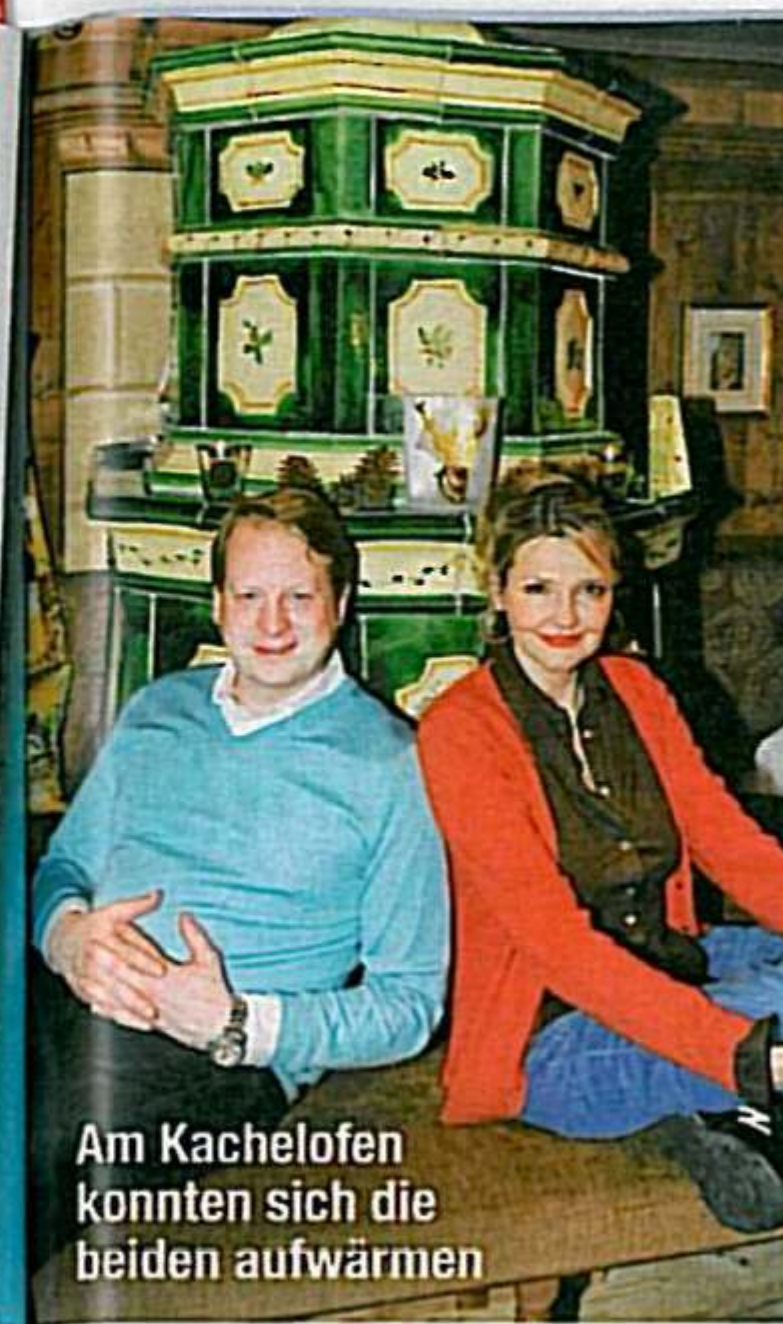
Am Kachelofen konnten sich die beiden aufwärmen