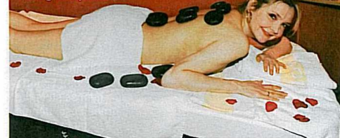
Bei der „Hot stone“-Massage konnte die Schauspielerin richtig entspannen